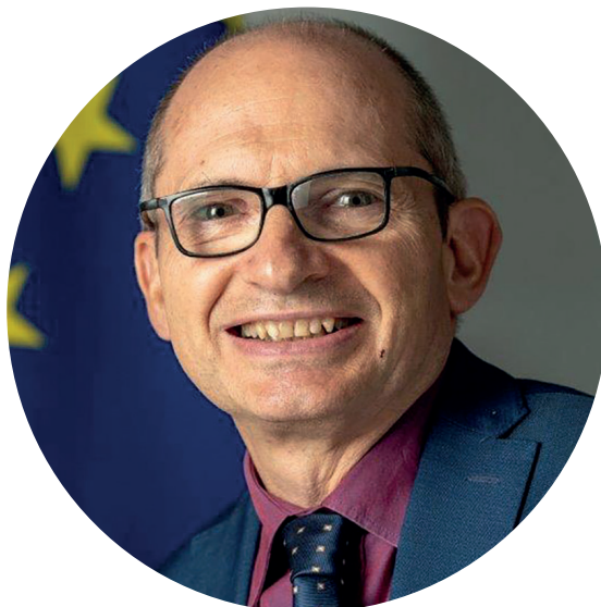
CLAUDE BOCHU Ambassadeur de l'Union européenne au Burundi